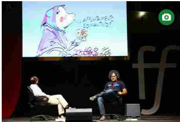
Festival della Filosofia: persona tema 2019